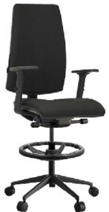
Thank You taburete