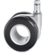
Ø 65 huecas